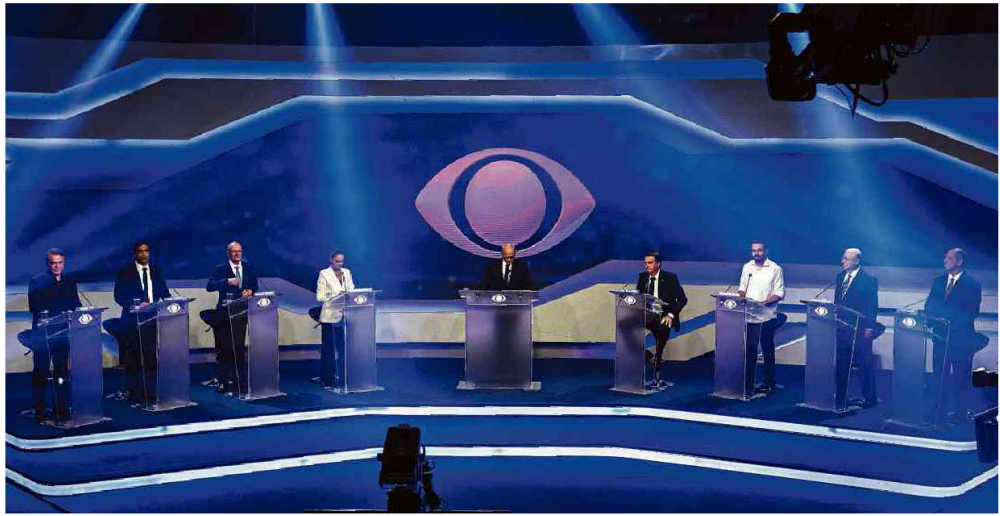
Da esq. para a dir., os candidatos à Presidência Alvaro Dias (Podemos), Cabo Daciolo (Patriota), Geraldo Alckmin (PSDB), Marina Silva (Rede), Jair Bolsonaro (PSL), Guilherme Boulos (PSOL), Henrique Meirelles (MDB) e Ciro Gomes (PDT), em debate televisivo na noite desta quinta-feira (9)

Aborto sempre ceifa uma vida humana inocente cotidiano B4